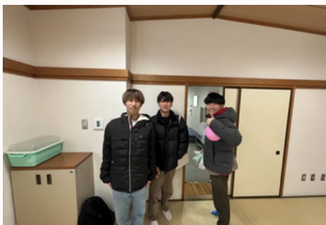
茗荷谷子どもスタジオ